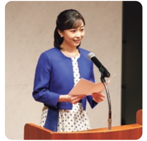
佳子内親王殿下より お言葉を賜りました