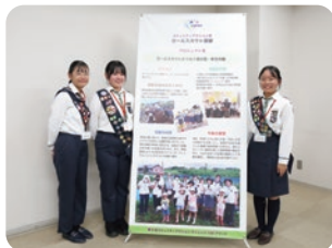
スカウト菜縁のメンバー